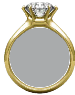
Talla correcta, el círculo calza perfecto en el anillo.